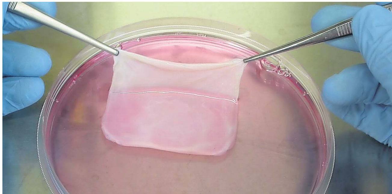
Im Labor wächst Ober- und Unterhaut innerhalb von 12 Tagen zur komplexen Haut des Patienten.

HÄLT MAN SICH DIE Probleme von Hautverbrennungen vor Augen, wird es leicht verständlich, dass gerade ein Kinderspital Hautforschung betreibt. Während sich die aufgeschürfte Haut innert Ta-